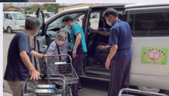
買い物等支援事業の様子