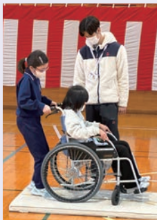
車イス体験の様子