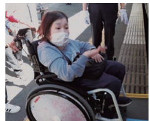
電車に乗車する様子