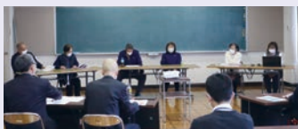
地域福祉推進事業報告会の様子